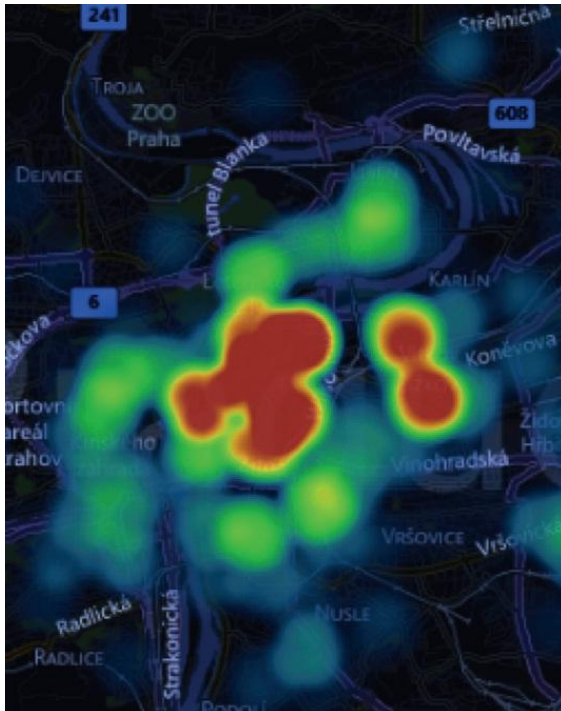
Rozložení turistů z Dánska v nočních hodinách na území Prahy